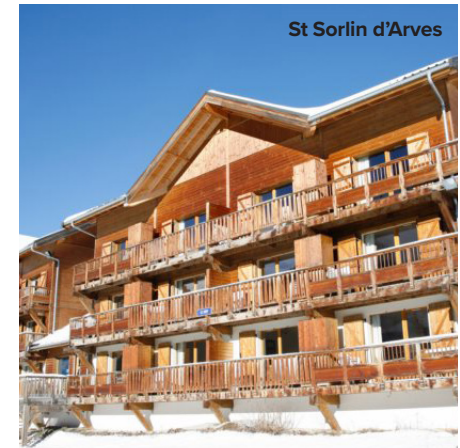
St Sorlin d'Arves