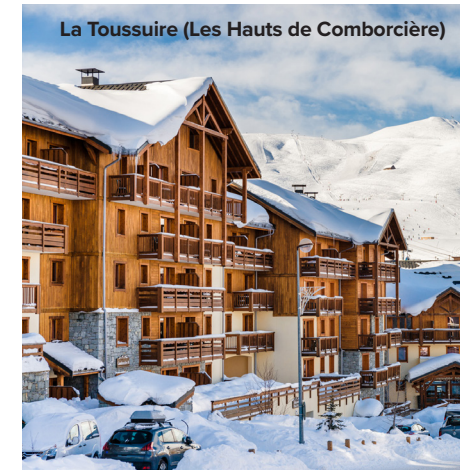
La Toussuire (Les Hauts de Comborcière)

Prix par personne, logement occupé par 4 personnes